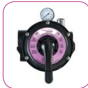
Vanne 6 positions 6 position valve Válvula 6 posiciones