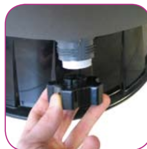
Drain avec son bouchon servant d'outil de démontage Drain with its plug which serves as dismantling tool - Drenaje que sirve para vaciar El agua del filtro y facilitar así la operación de invernación